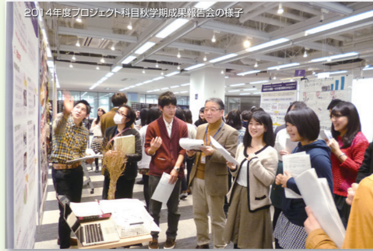
2014年度プロジェクト科目秋学期成果報告会の様子

昨今、アクティブ・ラーニング(Active Learning)への期待の高まりとともに、各高等教育機関では多様なアクティブ・ラーニングが導入されています。学習者の能動的な参加を促すこれらの授業形態において、質を高めるための学習支援は必要不可欠ですが、その学習支援者についての議論は充分とはいえないのが現状です。同志社大学PBL推進支援センターでは、TA/SA/LA(Teaching Assistant/Student Assistant/Learning Assistant)/チューターという立場で授業に関わる学生を学習支援者と位置づけた時に、その役割とは何か、また、さらなる可能性として何が求められているのか、教員・職員・学生などアクティブ・ラーニングに係る全ての関係者の視点からさぐっていきます。