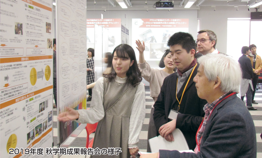
2019年度 秋学期成果報告会の様子

情報技術や人工知能技術AIの発達、グローバル化、少子高齢化がもたらす生産年齢人口の急減などに伴い、人の生き方が大きく変わろうとしています。そのような予見の困難な時代を担う若者のため、学校教育には今、校種間の接続を意識しながら、新たな価値を創造していく力を育成する必要性が求められていると言えるでしょう。