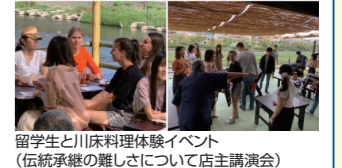
留学生と川床料理体験イベント(伝統継承の難しさについて店主講演会)